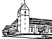
St. Odilia Hausen a.A.