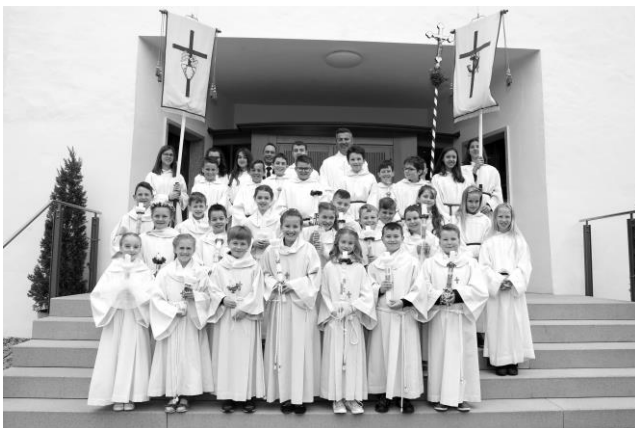
Erstkommunionfeier am Sonntag