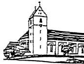
St. Odilia Hausen a.A.